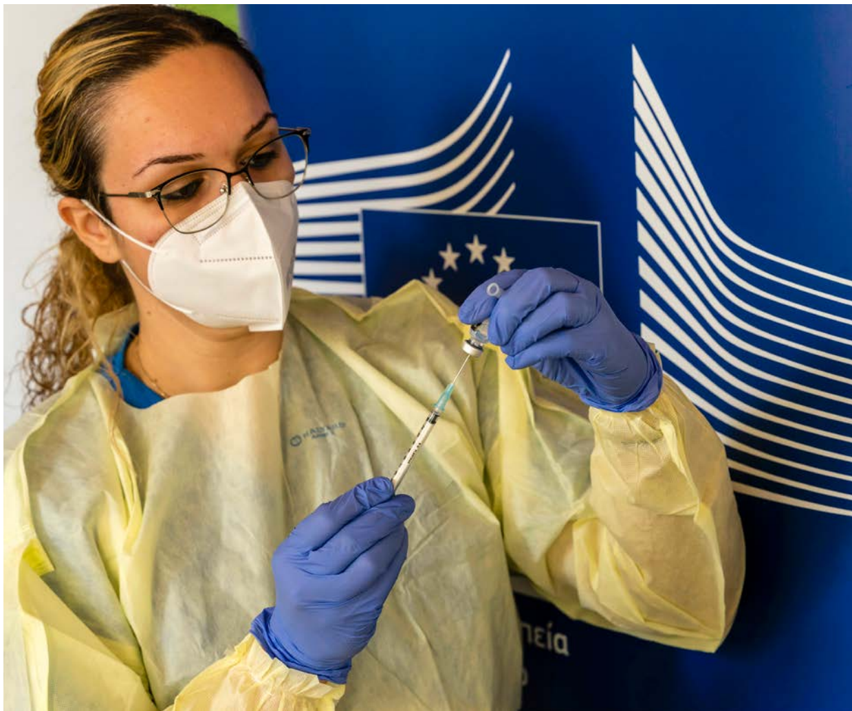
En sykepleier som gjør klar en koronavaksine-dose på et sykehjem.

// Antall byråer har økt de siste 20 årene. Flere av disse har blitt etablert som svar på grenseoverskridende kriser.