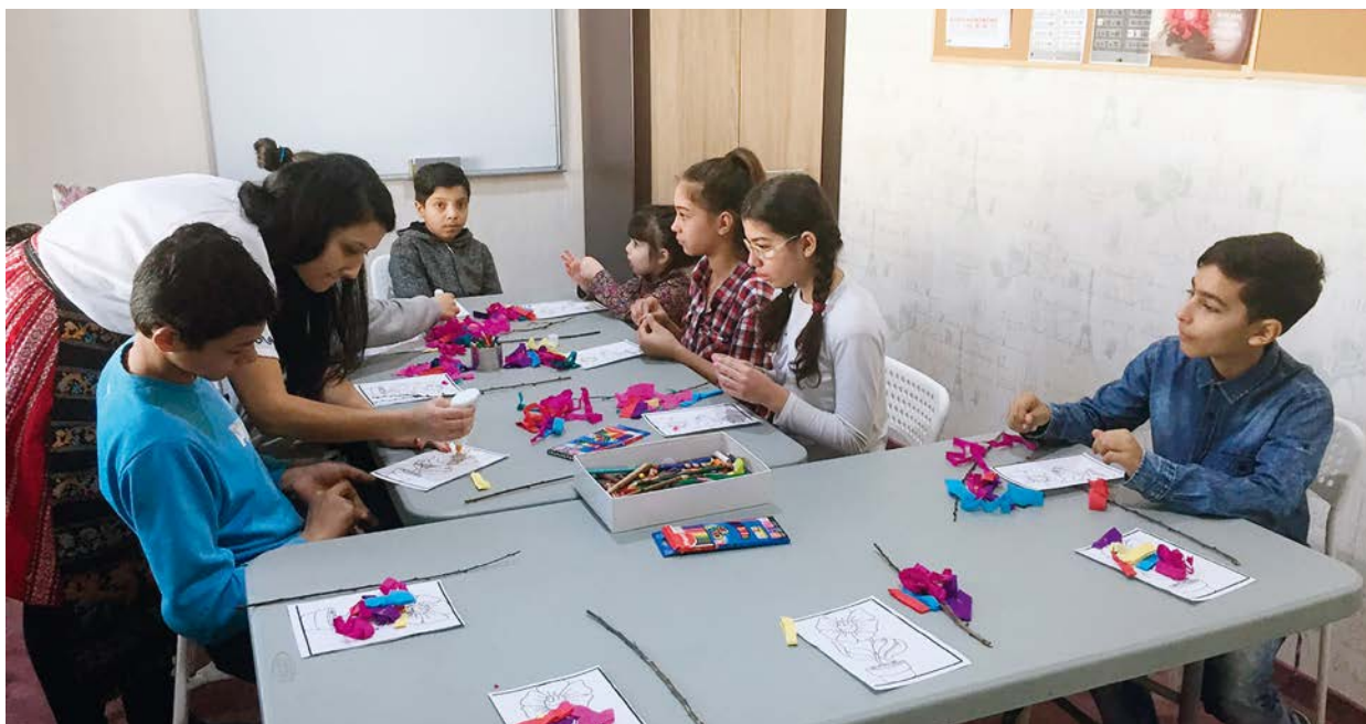
Med støtte fra EØS-midlene sikres rumenske barn skoletilbud. Dette prosjektet er ledet av Frelsesarmeen.

// EØS-midlene skal utjevne økonomiske forskjeller i Europa. Midlene er også ment for å styrke samarbeidet mellom Norge og mottakerlandet.