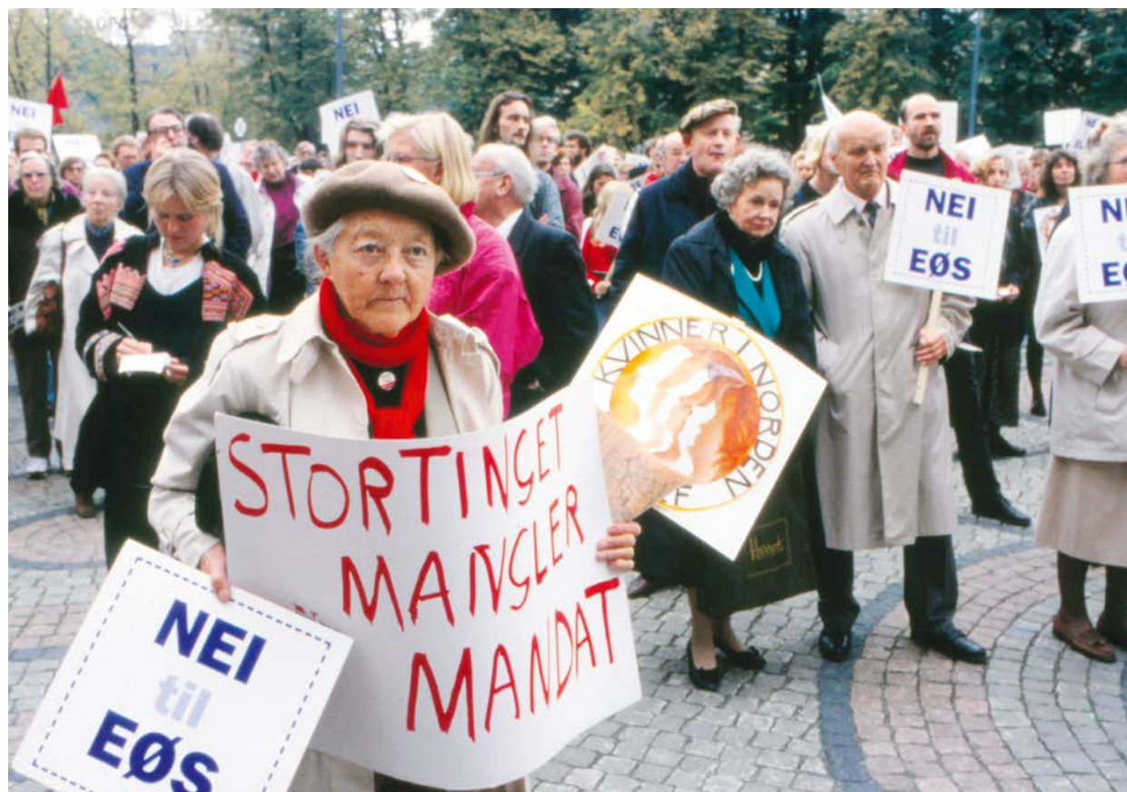
Motstandere av EØS-avtalen viser sin misnøye. Bildet er fra 1992, året avtalen ble inngått.

II EØS-avtalen gir Norge, Island og Liechtenstein en mulighet til å reservere seg mot nye EU-lover som de i utgangspunktet har forpliktet seg til å innføre.