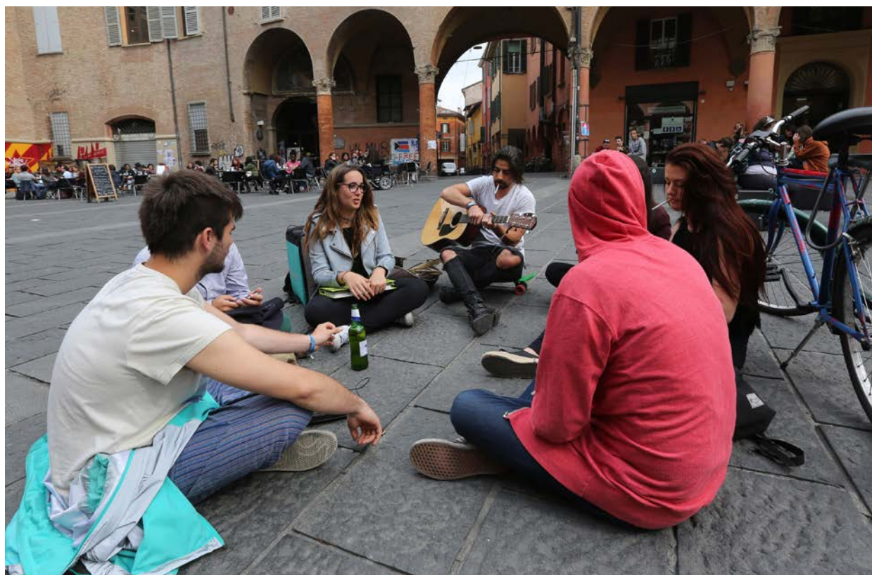
Erasmus-studenter i Bologna, Italia.

// Siden oppstarten i 1987 har over 3 millioner studenter reist på utveksling med støtte fra Erasmus-programmet.