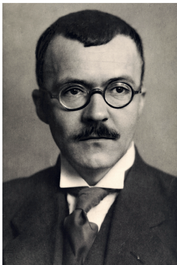
I Haag møttes også en delegasjon på 12 representanter fra Norge, deriblant forfatter og dikter Arnulf Øverland, som året etter stiftet Europabevegelsen i Norge.

Mange av forslagene fra kongressen førte senere til opprettelsen av Den europeiske kull- og stålunionen, forløperen til det vi i dag kjenner som Den europeiske union .