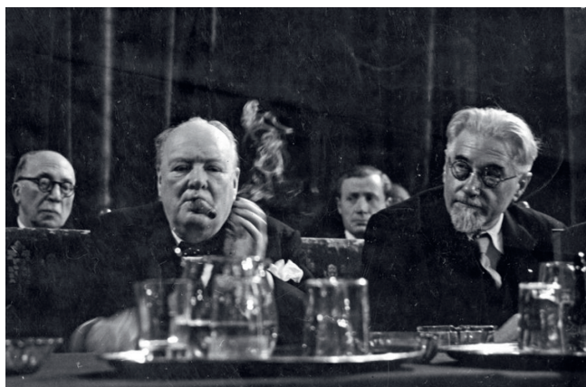
Winston Churchill og Frankrikes statsminister Paul Ramadier under Europakongressen.

Et viktig skritt for demokratiseringen av Europa fant sted i Haag i 1948, og ble senere kjent som Europakongressen, eller Haagkongressen. Kongressen ble innledet med en åpningstale av Storbritannias tidligere statsminister Winston Churchill. Han snakket om viktigheten av europeisk samarbeid for å beskytte befolkningene og motvirke fremtidige konflikter.