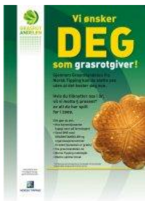
Plakat og brev mal fra Grasrotandelen

Etter at du har søkt frem ditt lag eller forening, kan det genereres et vervebrev med foreningens navn, strekkode og organisasjonsnummer. Vervebrevet er en A4 side i brev form. Lagre brevet på din datamaskin, skriv det ut eller send det til potensielle grasrotgivere, som igjen kan ta dette med til en kommisjonær. Vervebrev passer kanskje best i de tilfeller hvor du skal sende ut informasjon. Enkelt, både for grasrotgiver- og mottaker. Du kan også få maler for flyere og plakater (som under) for å verve givere til ditt lokallag. Det er viktig å gå inn på Norsk tippings sine sider og lese betingelsene. Linken finner du på www.jasiden.no